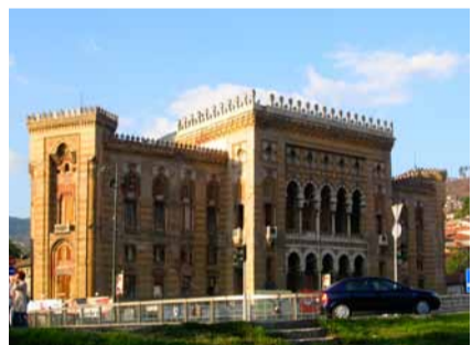
Národní knihovna Bosny a Hercegoviny shořela v roce 1992. Obnovit její provoz se dodnes nepodařilo.

Proto přišel s projektem na podporu bosenského vzdělávacího systému a posluchačů sarajevské univerzity, kteří za války přišli o unikátní studijní materiály.